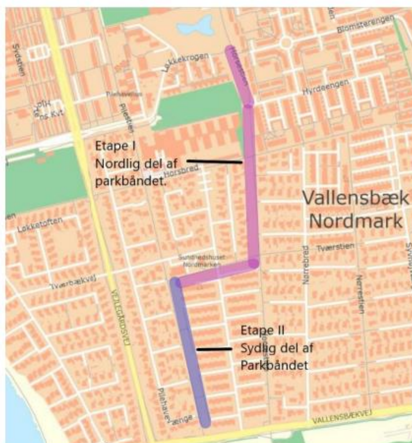
Figur 1 – Udstrækning af etape I og II i det rekreative løft af det grønne område Parkbåndet

I forbindelse med konkretisering af klimatilpassningsprojektet, er det erfaret at der kun bliver brug for at etablere regnvandsbassin på den sydlige del af Parkbåndet. Derfor er det aftalt, at Kommunens rekreative løft af det nordlige område af Parkbåndet (etape I) kører uafhængigt af HOFORs projekt, mens der arbejdes på en fælles løsning for den sydlige del af Parkbåndet (etape II), se Figur 1.