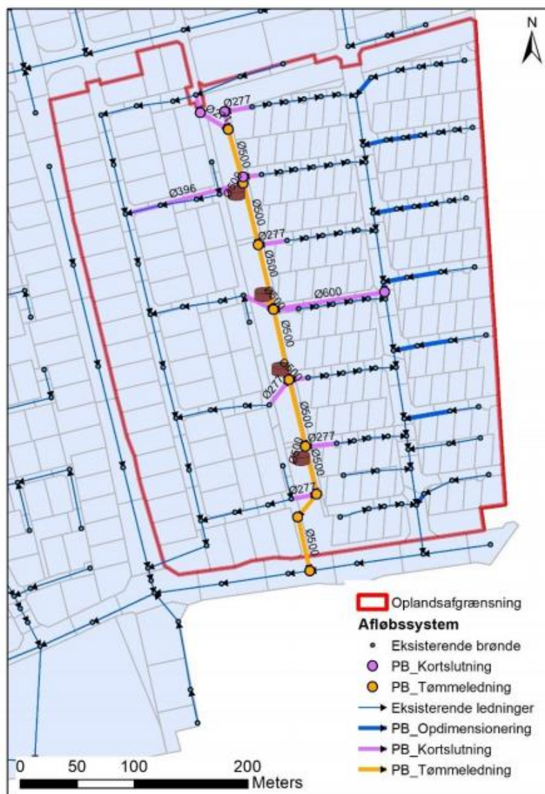
Figur 2 – Oversigtskort over det planlagte system for en fuld klimatilpasning af området

Figur 2 viser et oversigtskort over de projekterede ledninger, som hører til den samlede klimatilpassede løsning.